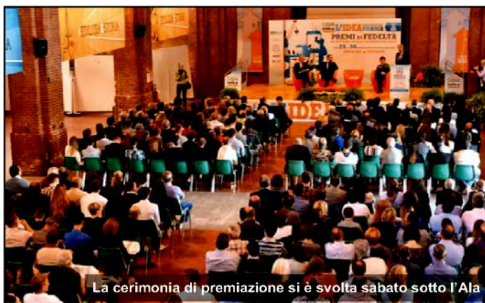
La cerimonia di premiazione si è svolta sabato sotto l'Ala

« Una cerimonia voluta nonostante il settore edile stia attraversando un momento particolarmente difficile - hanno detto durante la premiazione - abbiamo voluto comunque premiare chi,